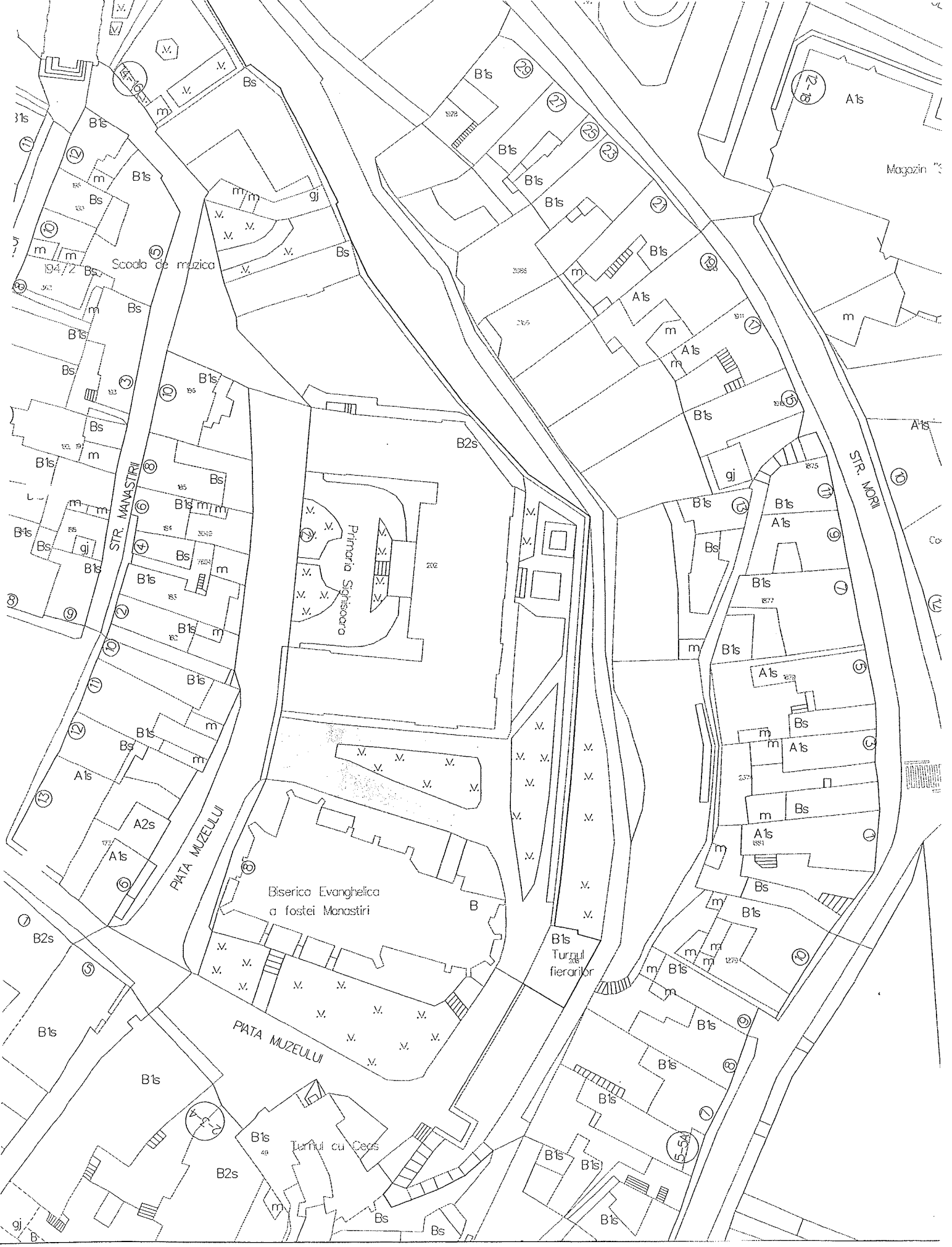
Anexa nr. 1 la H.C.L. nr. 149/30.06.2022